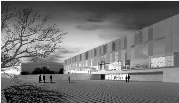
Palacio de Exposiciones y Congresos de Villanueva de la Serena, Badajoz. 2008 Concurso

En nuestra propuesta, los espacios de llegada y desalojo del Palacio de Exposiciones y Congresos se sitúan próximos a la nueva vía de circunvalación, unos espacios amplios y arbolados que miran hacia la población, permitiendo a los visitantes descender hacia el auditorio o ascender hacia las áreas de exposición. En su prolongación, hacia el sur, se ha reservado un lugar de fácil maniobra para el estacionamiento de autobuses. El edificio en consecuencia dará frente a la ciudad y espalda a las nuevas manzanas residenciales en las que situamos los accesos a las escenas del auditorio y sala de conciertos, y al garaje.